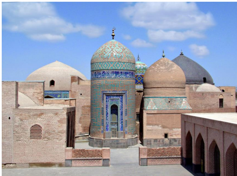
نمای عمومی پنج گنبد مجموعه

به باور برخی محققان جنت سرا جزء قدیمی ترین بناهای مجموعه است که در عهد شاه طهماسب اول با عنوان ایوان جنت سرا معروف بوده است. حسب صریح الملک این بنا توسط دختر شاه اسماعیل به عنوان مقبره برای پدر مورد نظر بوده است. در دوره های بعد مخصوصاً قاجار، از این فضا به عنوان مسجد استفاده شد.